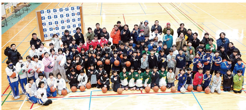
最後は参加した全24チームで記念撮影