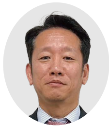
(有)匠セイク合同設計 村中 耕作