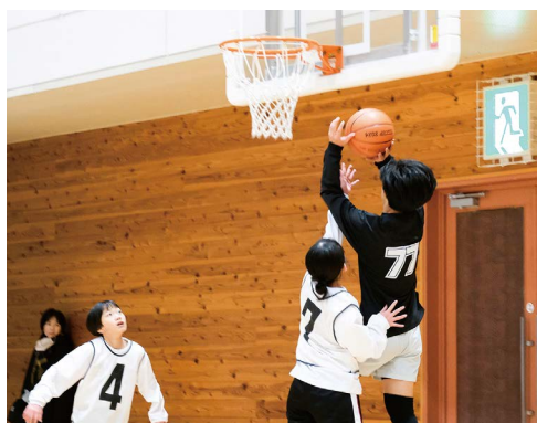
参加者の好プレーが連発!!

小学生を対象にした倉吉YEG主催のバスケットボール大会。今年で早くも3回目の開催です。