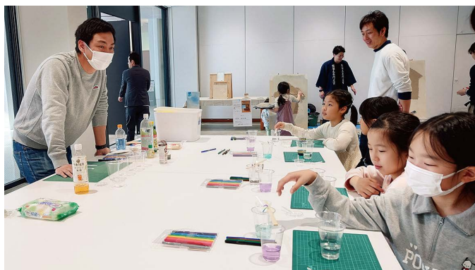
みんな実験に興味津々!